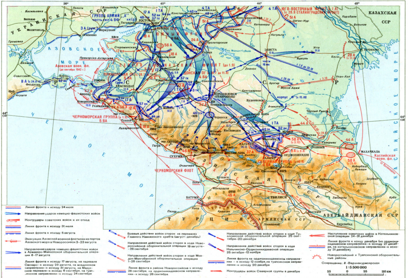
БИТВА ЗА КАВКАЗ. ОБОРОНИТЕЛЬНЫЕ ОПЕРАЦИИ 25 июля – 31 декабря 1942 г.